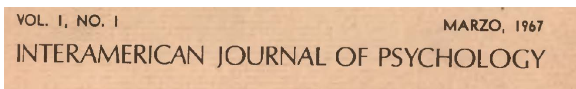
Figure 1. Primer encabezamiento del primer número de la RIP/IJP

La revista se publica en cuatro idiomas (español, francés, inglés y portugués), tres veces al año. Además, la Mesa Directiva de la SIP decidió en 2013 el operar bajo las directrices de los diferentes acuerdos de Budapest, Berlín, y Bethesda de acceso abierto (Suber, 2012) y proporcionar un acceso abierto a la revista y a los/as autores/as que sometan y publiquen sus trabajos de forma gratuita.